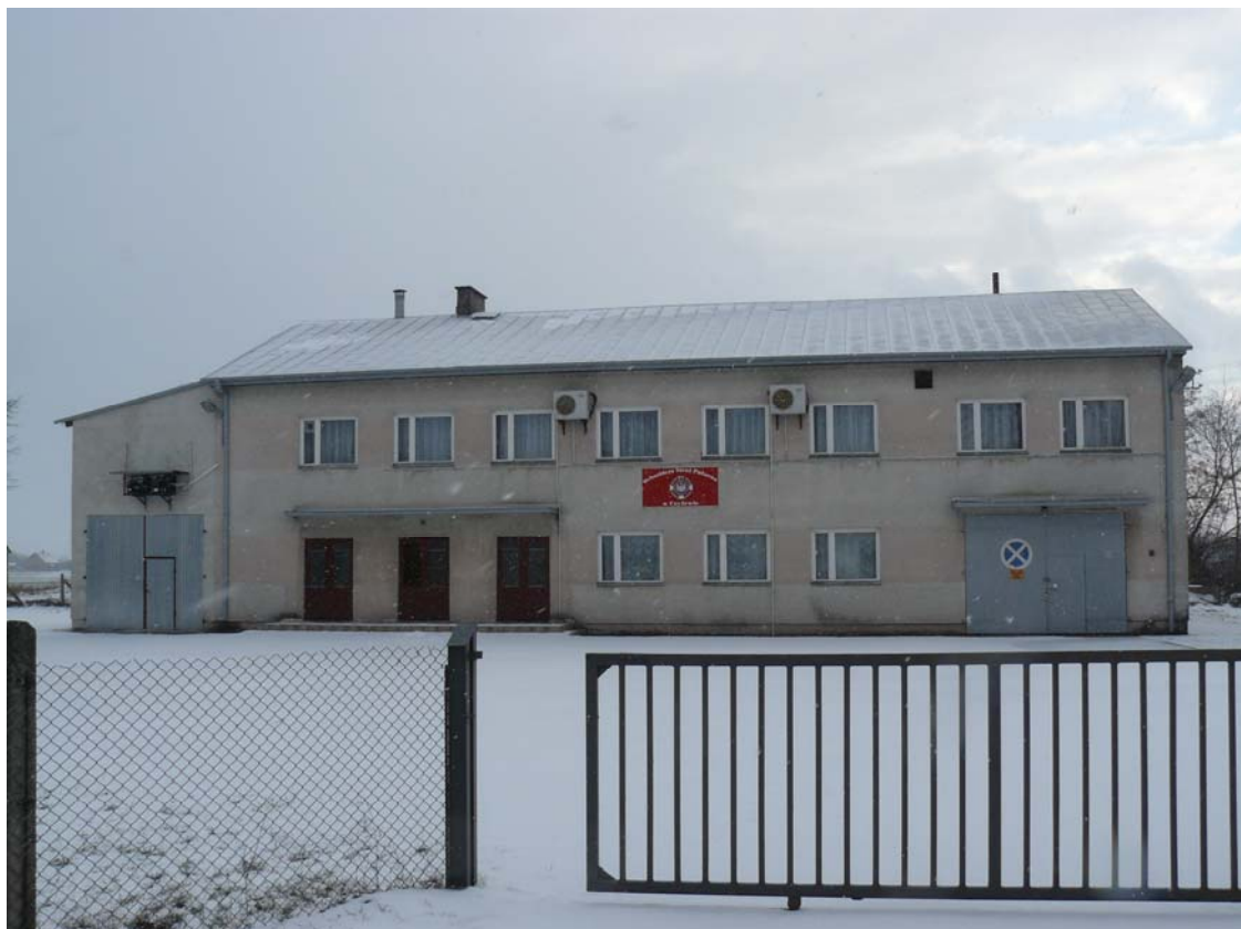
Zdjęcie nr 6: Remiza Ochotniczej Straży Pożarnej w Czyżewie.

W miejscowości Czyżew istnieje jednostka Ochotniczej Straży Pożarnej. Na terenie sołectwa znajduje się remiza strażacka, która pełni rolę świetlicy wiejskiej. To miejsce spotkań dorosłych, młodzieży i dzieci. Obecnie budynek remizy Ochotniczej Straży Pożarnej w Czyżewie pełniącej rolę świetlicy wiejskiej wymaga przeprowadzenia prac remontowych oraz zagospodarowania terenu wokół niej.