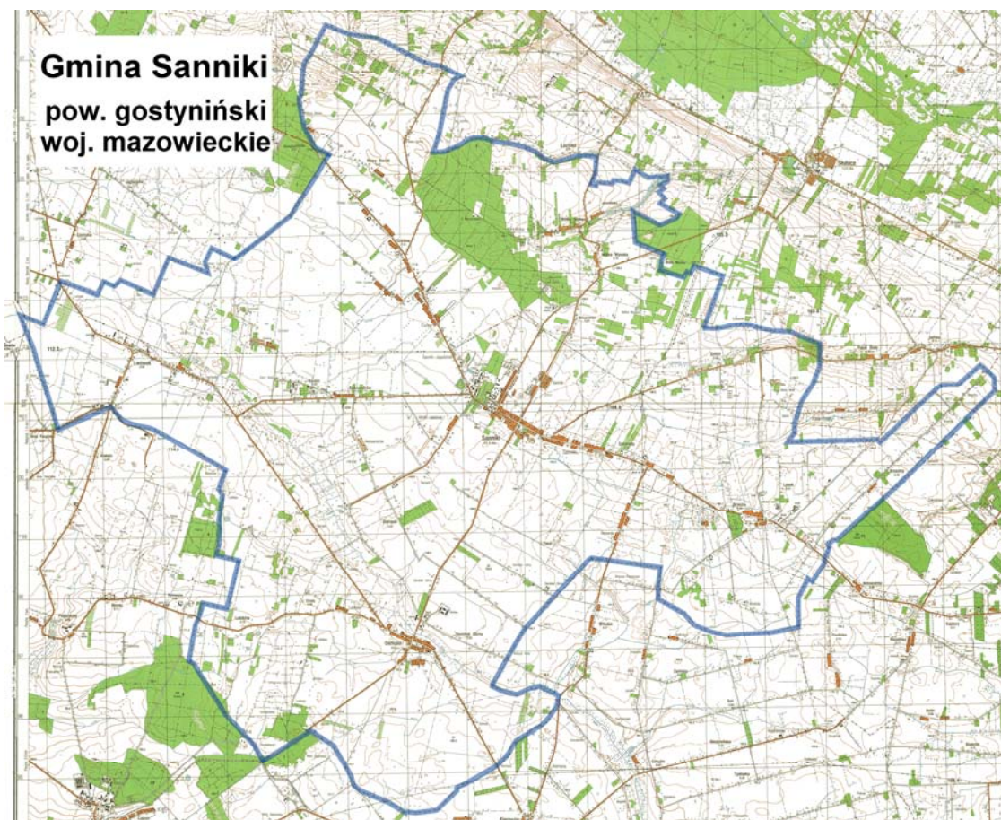
Mapa nr 1: Gmina Sanniki.

Czyżew to jedno z 18 sołectw na terenie Gminy Sanniki. Położone jest w centrum Polski w odległości około 30 km od Łowicza, Płocka i Sochaczewa oraz około 90 km od Warszawy. Przez sołectwo przebiega droga wojewódzka nr 577.