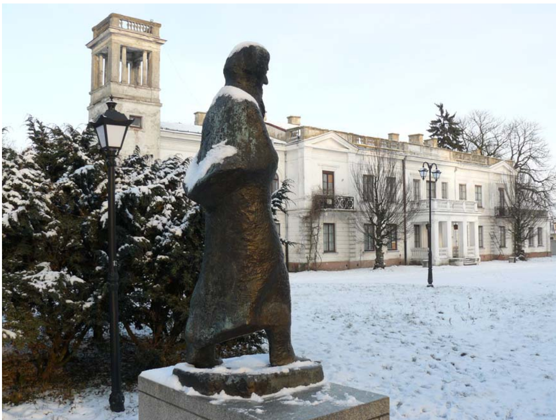
Zdjęcie nr 3: Pałac w Sannikach.