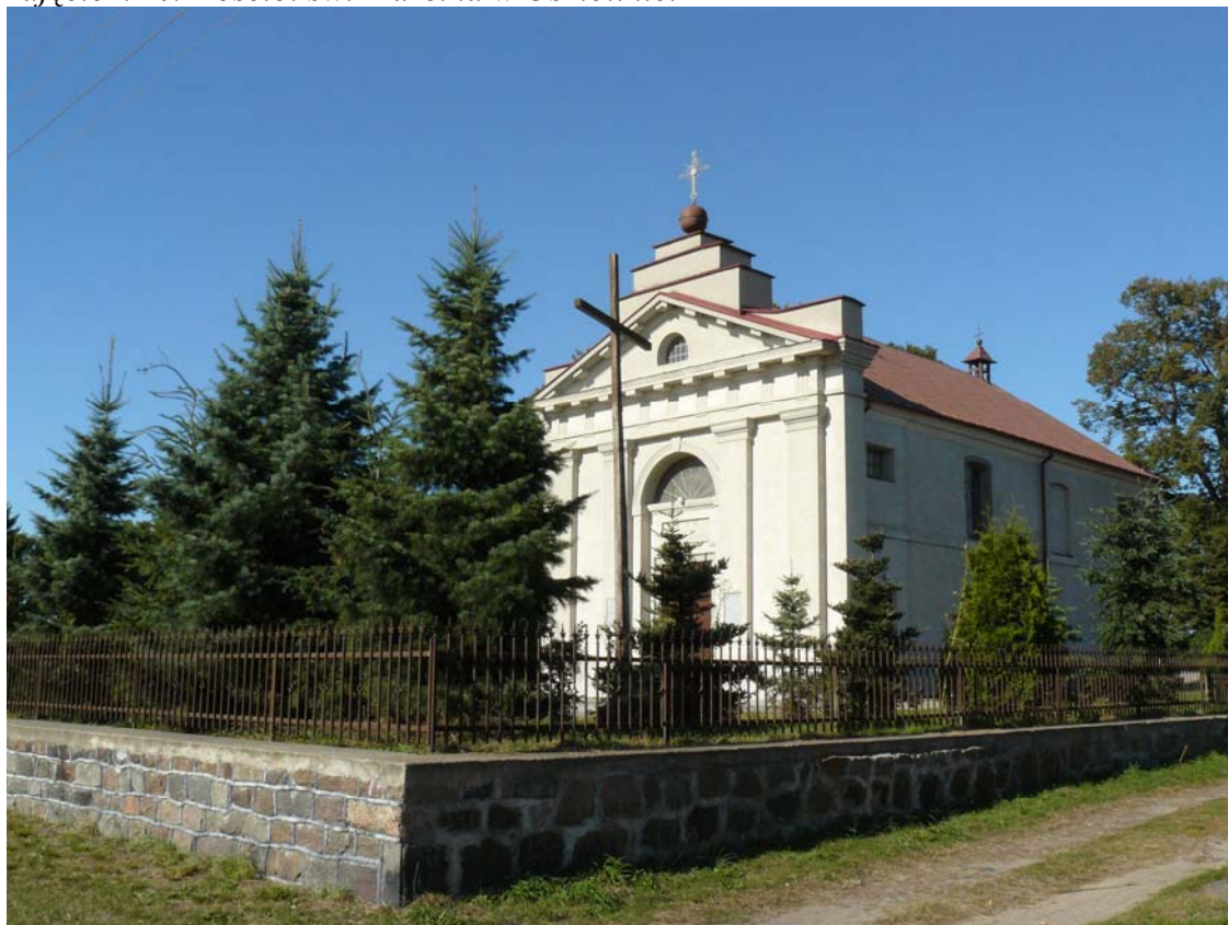
Zdjęcie nr 4: Kościół św. Marcina w Osmolinie.