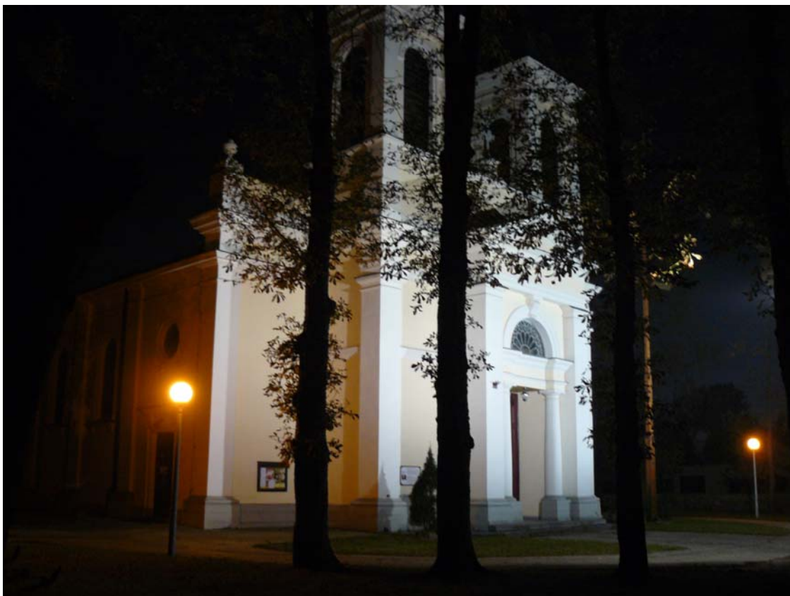
Zdjęcie nr 2: Kościół św. Trójcy w Sannikach.