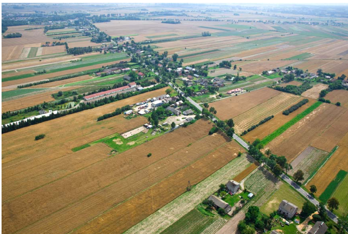
Zdjęcie nr 1: Miejscowość Czyżew.

otoczenia, jak również włączenie jej w proces rozwiązywania problemów swojej małej Ojczyzny. Mieszkańcy wsi są jej siłą napędową. Wykorzystując zasoby sołectwa, kulturę i tradycje dążą do nieustannego rozwoju swojej miejscowości, a tym samym poprawy warunków życia na wsi. Dlatego też podstawę podejmowanych działań stanowić będzie zachowanie tożsamości i integralności wsi w wymiarze społecznym wraz z całym dziedzictwem przyrodniczym, kulturowym i historycznym. Dzięki inicjatywie podjętej przez mieszkańców Czyżewa powstała mała strategia rozwoju wsi.