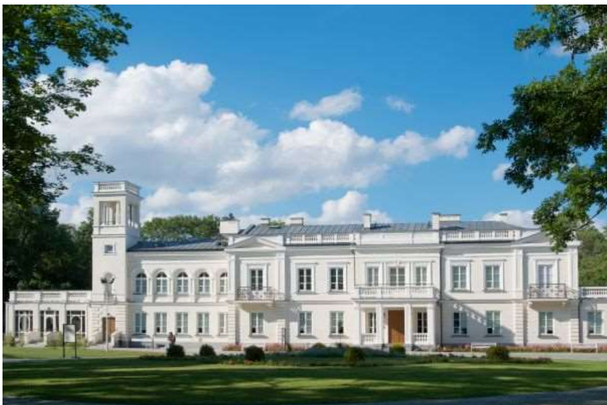
Rysunek 1. Zespół pałacowo-parkowy im. Fryderyka Chopina w Sannikach